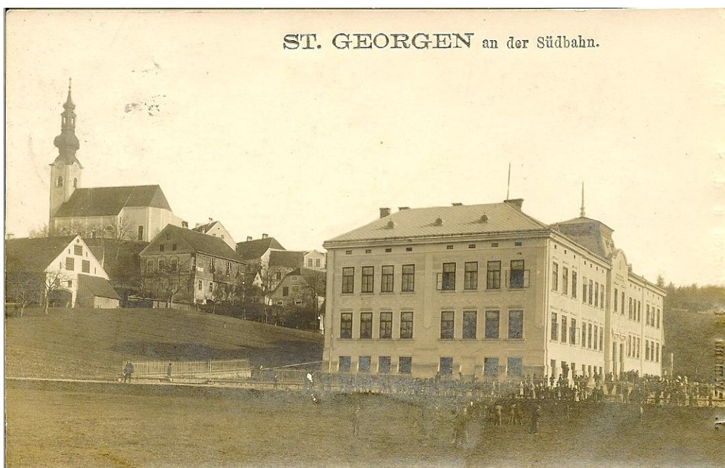
Slika 1: Otvoritev matične šole, 1909

Najstarejša stavba zavoda je del podružnične šole, ki je bil zgrajen leta 1907, na matični šoli pa je njen najstarejši del secesijska stavba iz leta 1909.